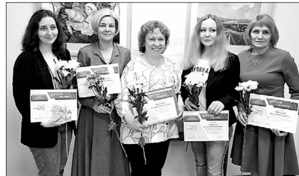
■ Участники конкурса «Библиотекарь года – 2023»

Центральная городская библиотека имени М. В. Ломоносова объявляет о проведении конкурса профессионального мастерства «Библиотекарь года – 2024» среди специалистов муниципальных библиотек Архангельска.